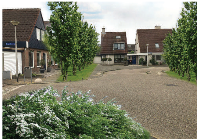
Impressie van een straat met meer groen