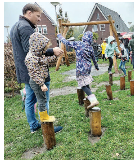
natuurspeeltuin De Landerije